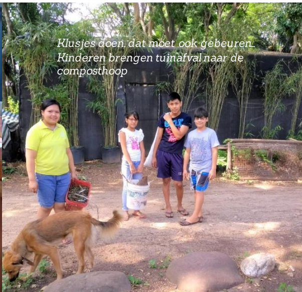
Klusjes doen, dat moet ook gebeuren. Kinderen brengen tuinafval naar de composthoop

Nu nog even een persoonlijke noot: Ik ben heel dankbaar voor de covid gespaard te zijn, maar ben helaas een tijd geleden nogal hard gevallen op mijn billen. Dit heeft me een gekneusd stuitje opgeleverd en ik heb daar erg lang last van gehad. Ik dacht aanvankelijk dat het meeviel en ging dus gewoon door met alles in mijn gebruikelijke tempo, maar dat bleek niet helemaal zo verstandig. Ik heb dus enkele weken praktisch de hele dag plat moeten liggen. Nu gaat het gelukkig beter. Een mens is dus nooit te oud om te leren. En...hebben jullie mijn boekje al gelezen? Ik zou het fijn vinden om jullie reactie te horen. Stuur gerust eens een e-mailtje of berichtje via Whatsapp. ( altena.therese@gmail.com / +59-167709556)